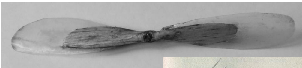
Une belle hélice à pales "invisibles", due à Claude Weber, qui serait intéressante pour le Jabiru.

A titre expérimental, je l'ai recouvert en papier noir, peint en alu après masquage des nombreuses lettres et fenêtres. C'est très net, mais il faut pas mal de peinture pour masquer le noir et le modèle est alors trop brillant. Il faudrait peut-être mélanger du blanc à l'aluminium pour avoir une couleur satinée plus réaliste.