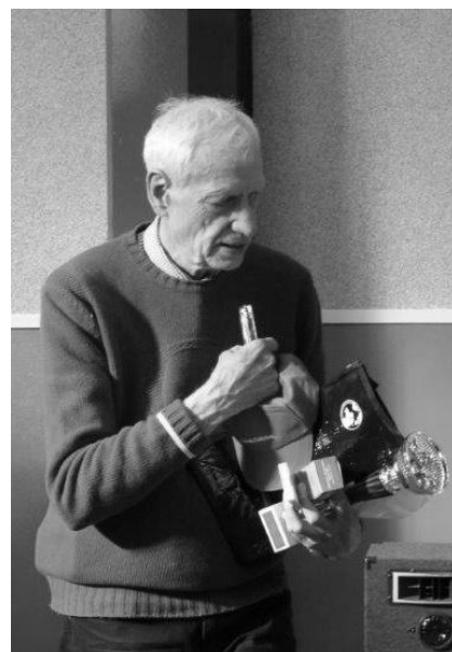
Les cacahuèteux (tistes ?) ne semblent pas avoir été trop maltraités !