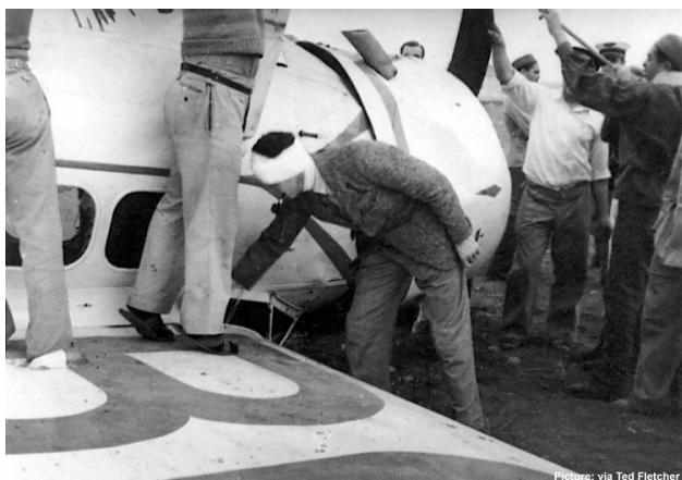
Sur le dos à Alep. On voit bien l'immatriculation.