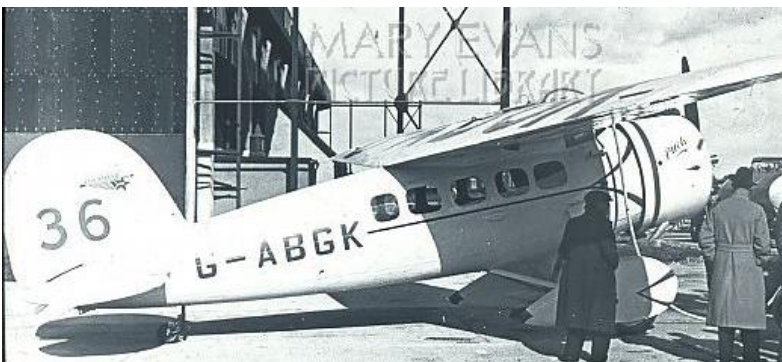
Au départ de Londres-Melbourne