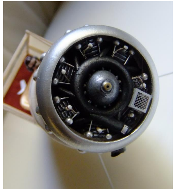
Quelques détails du Waco de Enrique Maltz. O appréciera les détails du moteur, en particulier les bossages si difficiles à bien faire, le tableau de bord en ronce de noyer et le fait que le pilote soit un amateur de modèles réduits...