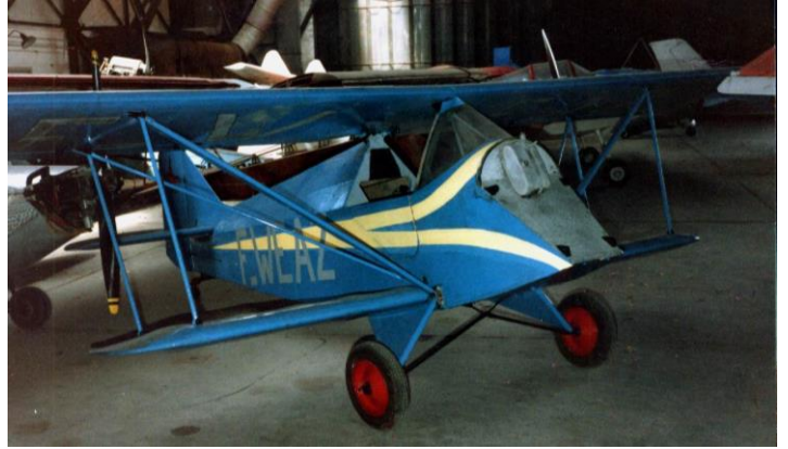
En haut le MW-25 photographié par le RSA, et son petit frère Cacahuète à peu près sous le même angle. On notera une petite erreur dans le placement des lettres F-W. En dessous le MW-25 en biplan sans moteur au Musée du RSA de Brienne en 198?... JC