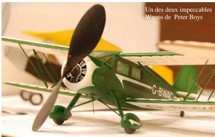
Un des deux impeccables Wacos de Peter Boys