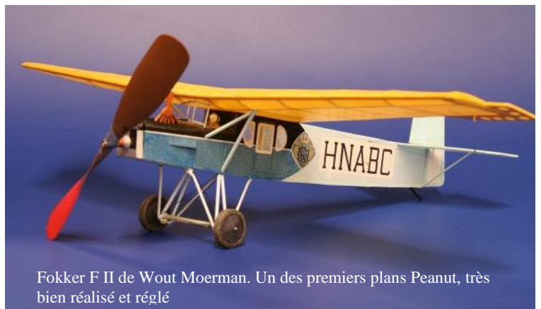
Fokker F II de Wout Moerman. Un des premiers plans Peanut, très bien réalisé et réglé