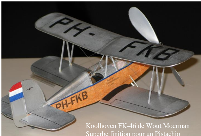
Koolhoven FK-46 de Wout Moerman Superbe finition pour un Pistachio