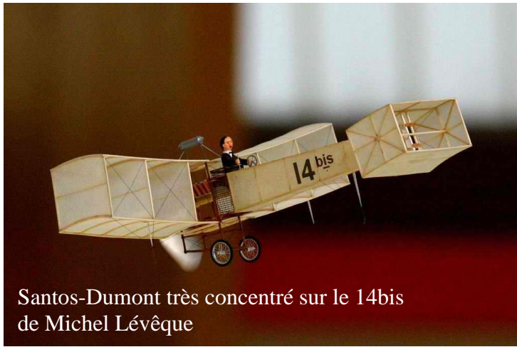
Santos-Dumont très concentré sur le 14bis de Michel Lévêque