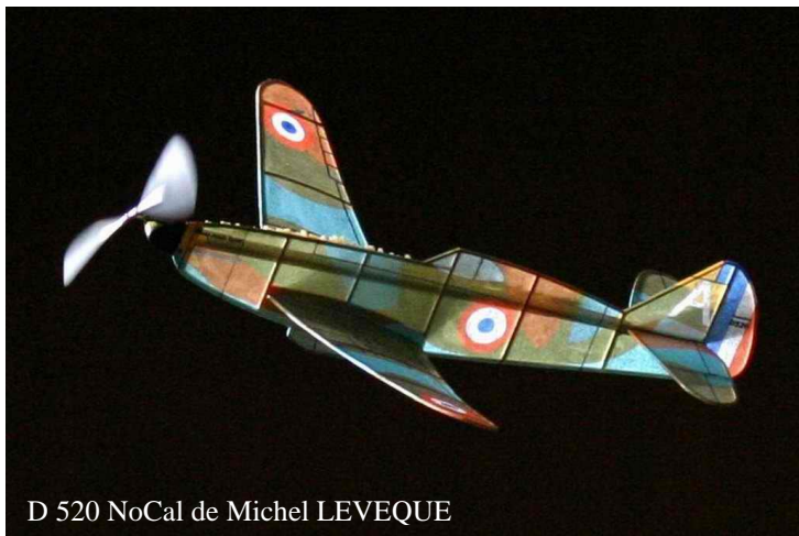
D 520 NoCal de Michel LEVEQUE