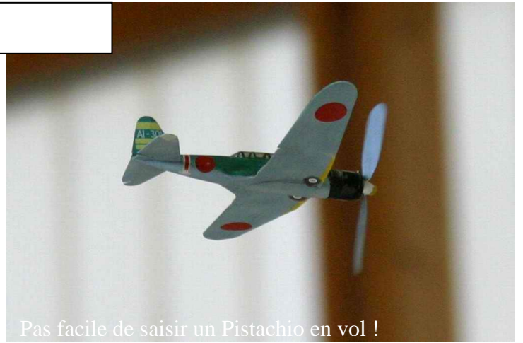
Pas facile de saisir un Pistachio en vol !