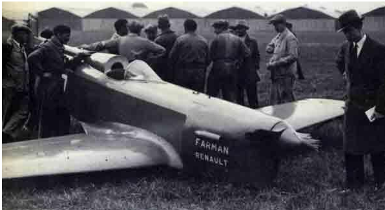
N.A.C.A. Technical Memorandum No. 724