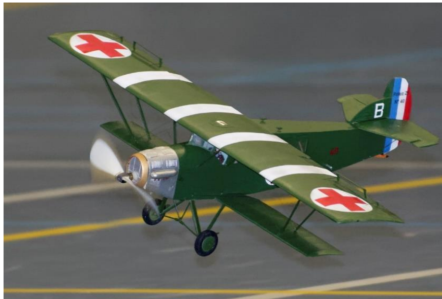
Potez P-29 sanitaire utilisé à Ivato (Madagascar) en 1935.