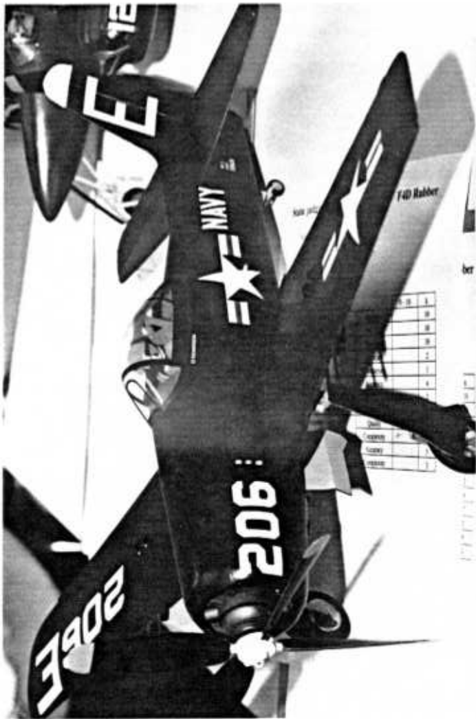
Grumman Bearcat d'Antonin Alféry. Finition superbe, très réaliste, très bons vols... Que dire