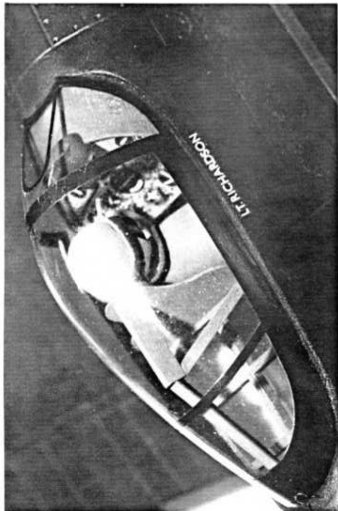
de plus? Que le Tigercat est encore mieux!