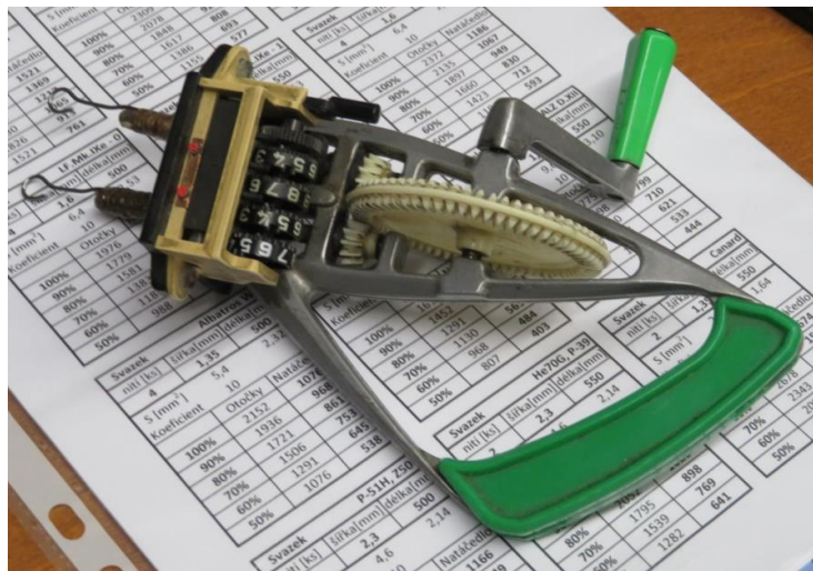
Remontoirs tchèques analogiques en haut (et double !) et à gauche, numérique dessous.