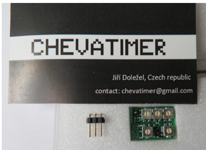
Timer tchèque, à peu près à la taille réelle. Prix 28 € si je me souviens bien !