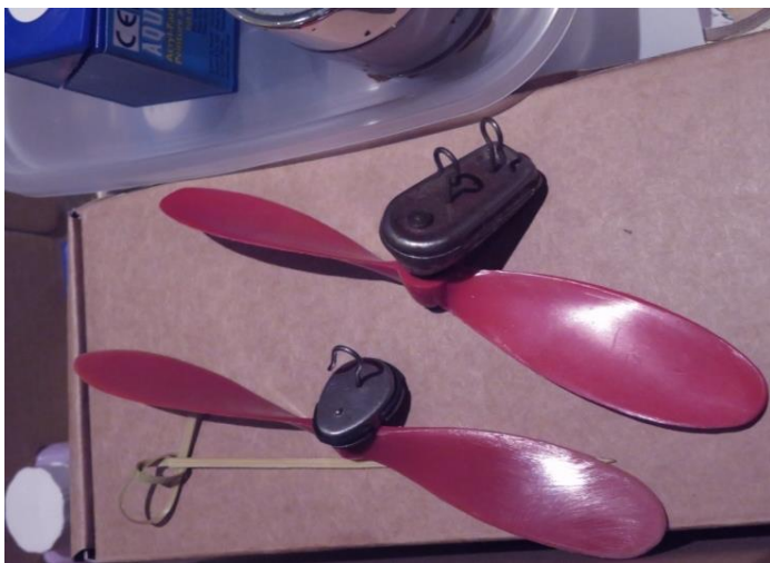
Deux multiplicateurs provenant de boites de construction des années 50.