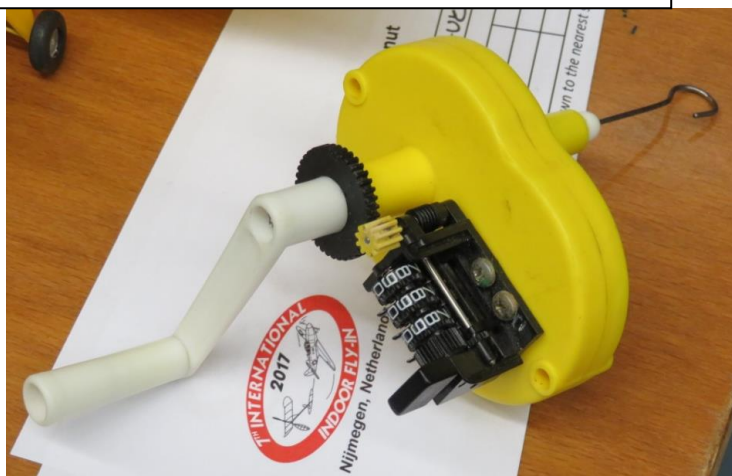
Vu à Nimègue