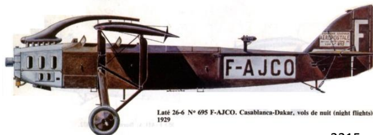
Laté 26-6 N° 695 F-AJCO. Casablanca-Dakar, vols de nuit (night flights) 1929