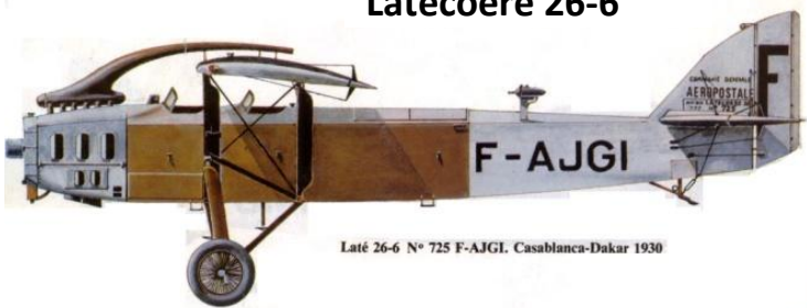
Laté 26-6 N° 725 F-AJGI. Casablanca-Dakar 1930