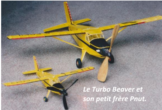
Le Turbo Beaver et son petit frère Pnut.

Rappel des règles qui sont d'une simplicité biblique : 66 cm max d'envergure, hélice max 1/3 de l'envergure, dièdre 4 cm de plus que le vrai. Jacques Delcroix nous a fait cadeau d'une de ses meilleures maquettes, le Citabria, qui a le bon goût de n'occuper que 2 feuilles A3 dans les Cahiers!