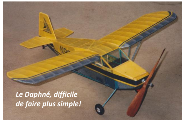
Le Daphné, difficile de faire plus simple!