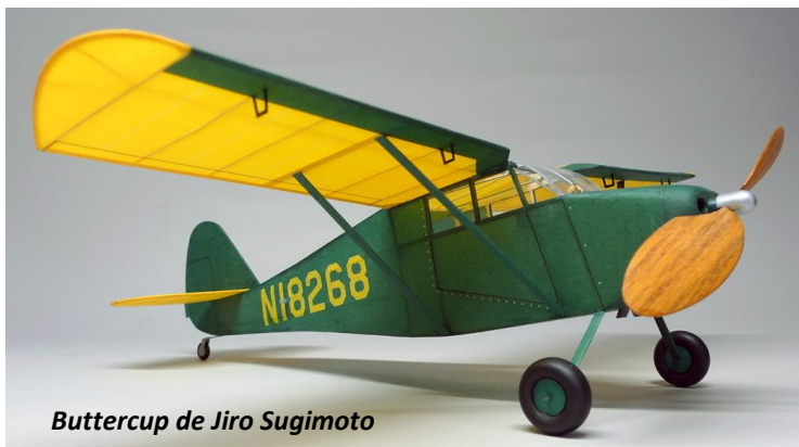
Buttercup de Jiro Sugimoto