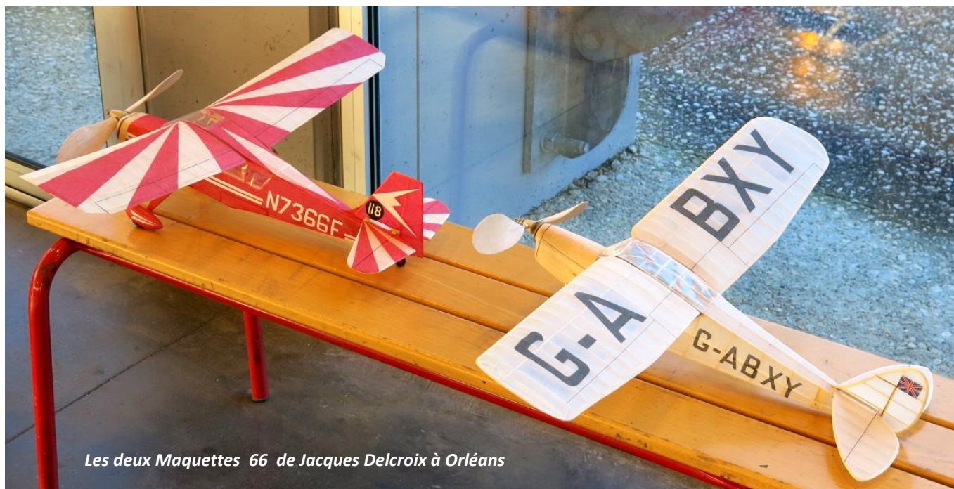
Les deux Maquettes 66 de Jacques Delcroix à Orléans