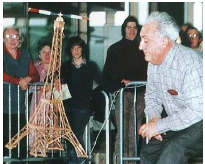
A l'heureuse époque des "Fous Volants", la tour Eiffel volante faisait les délices d'un nombreux public, car c'était dans le hall de l'aérogare d'Orly en 1988.

J'ai rencontré Claude pour la première fois sous