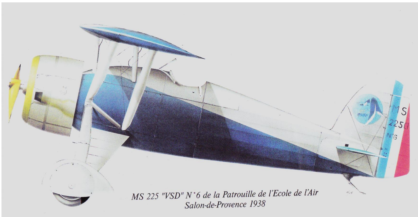
MS 225 "VSD" N°6 de la Patrouille de l'Ecole de l'Air Salon-de-Provence 1938

La Marine reçut 16 MS-225 en 1934 pour l'escadrille 3C1. Les avions semblent être gris-bleu dessus et dessous, avec 3C1 en grands caractères blancs sous l'aile droite et le numéro sous l'aile gauche.