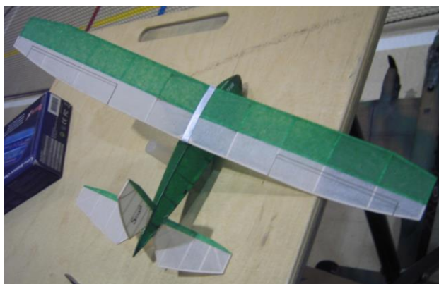
Un des planeurs essayé, le Scub des années trente.