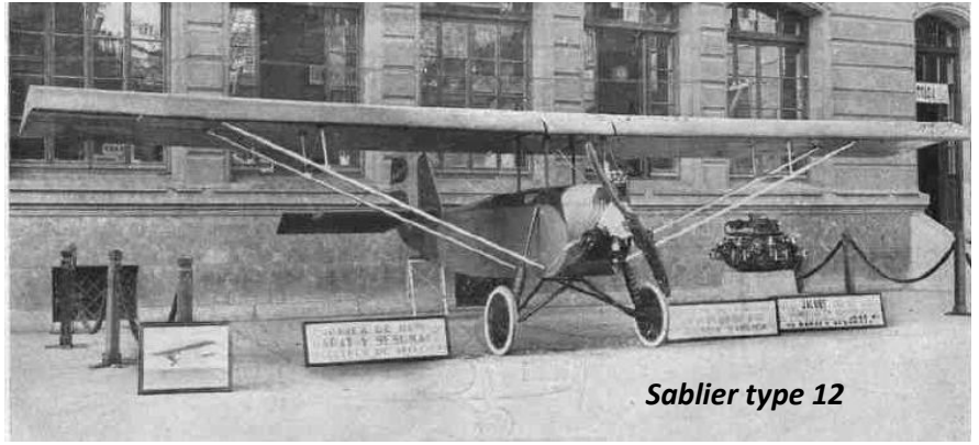
Sablier type 12

GS dessinait beaucoup, peut-être trop. De trop nombreuses idées sont restées à l'état d'ébauche. Le papier à lettre de la Viscaiana Aviacion, ci-contre à gauche, dont il prit la direction technique, montre une série impressionnante de projets dont aucun ne vit le jour, et qui semblent bien arriérés pour des modèles de 1935-36. On a un peu l'impression que GS était capable de dessiner une Forteresse Volante, bois et toile à la demande!