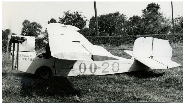
Le type 52 belge, l'avion mystère!