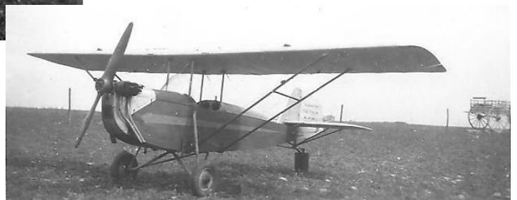
Photo mystère trouvée par Alain Parmentier. L'aile a du dièdre, la dérive est encore différente. Elle porte Avionnette GS type 4. Le moteur semble être un AVA à quatre cylindres, avec des échappements comme sur le Farman 451. Décoration soignée, mais couleur inconnue.

Le site Aviafrance donne cette photo sans commentaires. Dérive simplifiée et train élargi. Le moteur semble aussi être un Poinard. Profil creux, mais assez mince, comme sur le F-WFOP.