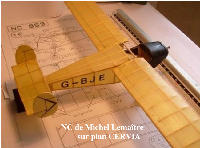
NC de Michel Lemaître sur plan CERVIA