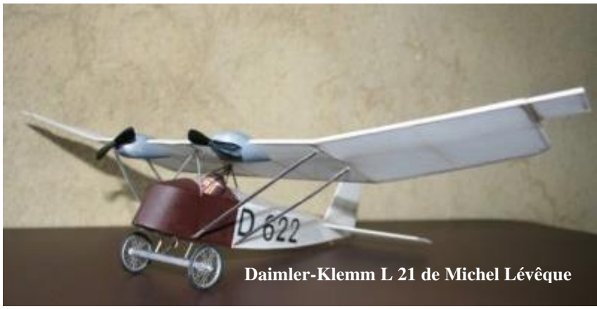
Daimler-Klemm L 21 de Michel Lévêque