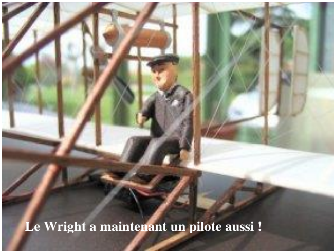
Le Wright a maintenant un pilote aussi !