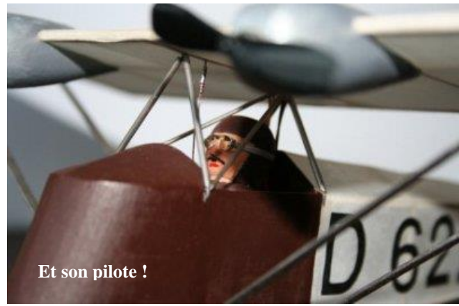
Et son pilote !