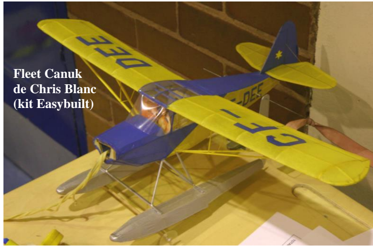
Fleet Canuk de Chris Blanc (kit Easybuilt)