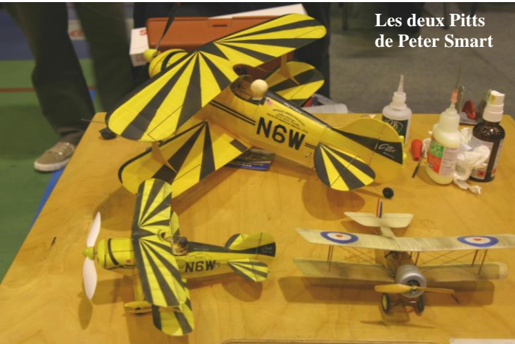
Les deux Pitts de Peter Smart