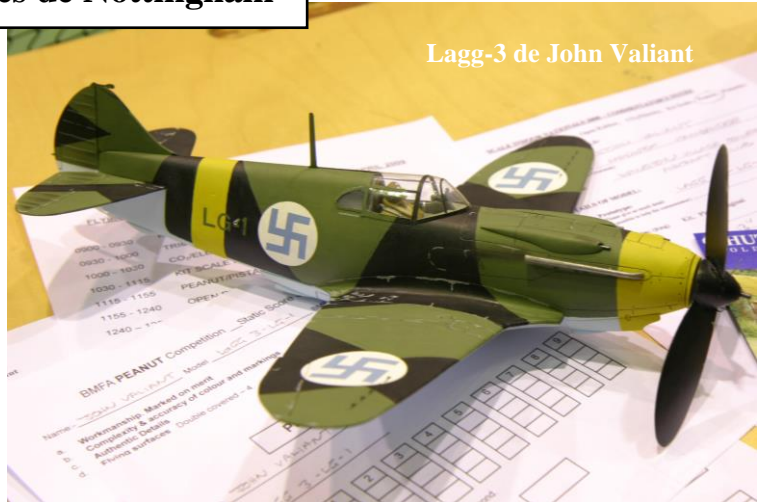
Lagg-3 de John Valiant