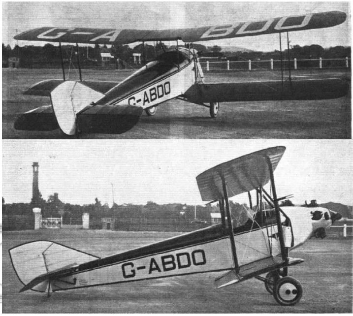
Les photos ci-contre sont celles du prototype de 1930. Rouge et alu. Le modèle restauré, dernier survivant de la série (10 ?), est en page couleur.