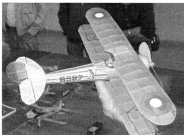
Nieuport 28 de Roger Aime (plan dans le n° 41)