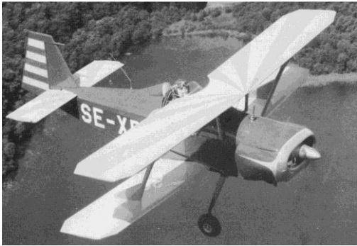
Turbo Mentor en essai à Tours dans les années 90