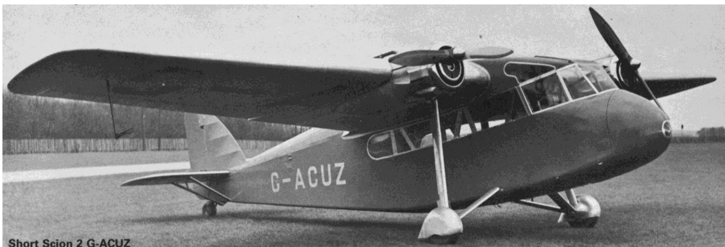
Short Scion 2 G-ACUZ

Et pourquoi pas une version électrique de ce sympathique bimoteur ? JC