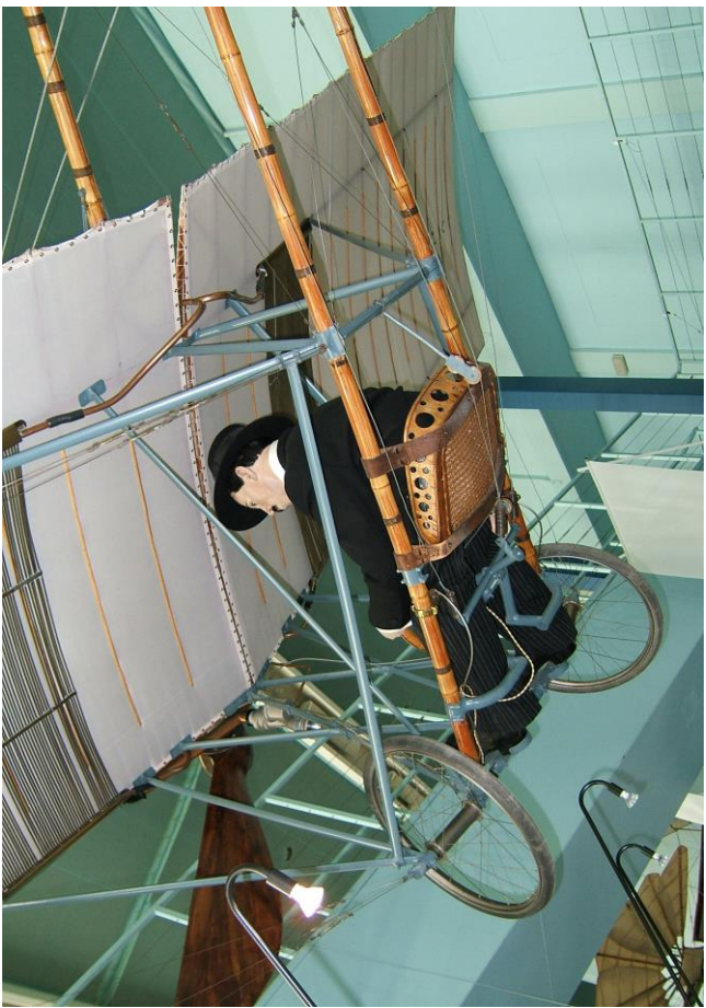
Deux vues de détails de la Demoiselle du Bourget