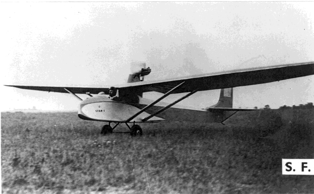
S. F. A. N. - I