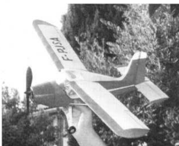
Legrand-Simon - envergure 68 cm - 2 cadmium 110 mha meilleur vol 3:17 s - 1 er Coupe 4A - Août 2003