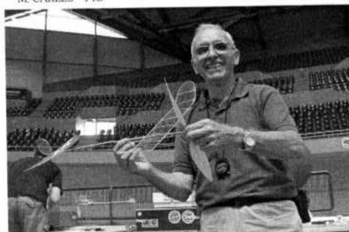
E. ROCH – FIL