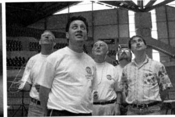
Le nez en l'air!