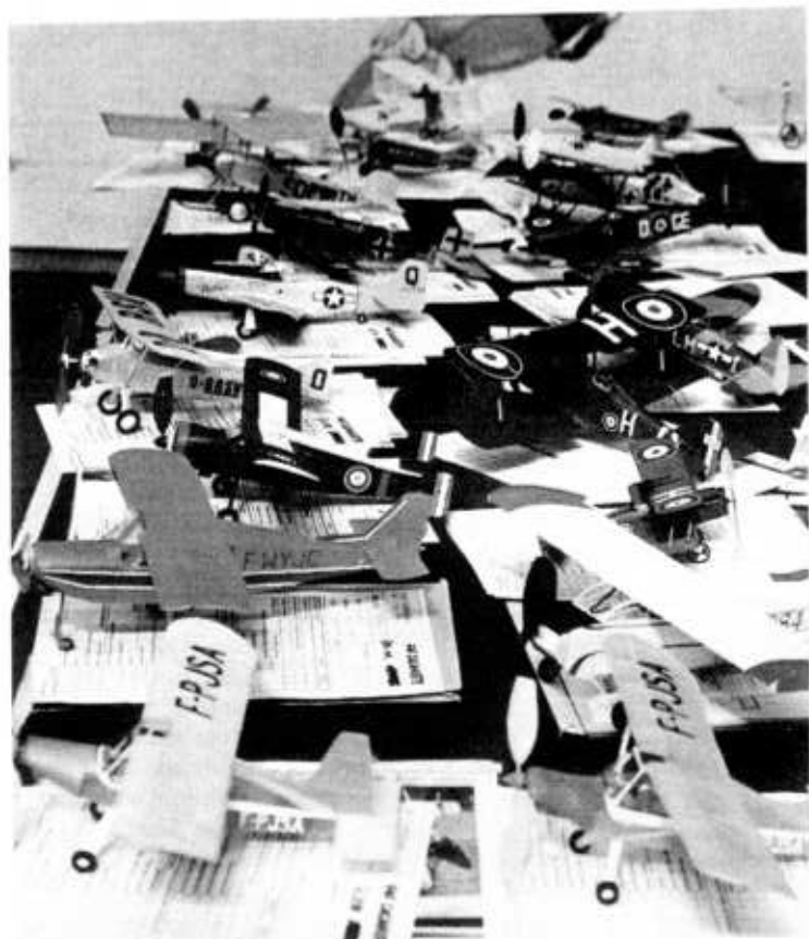
Du travail pour le jury !