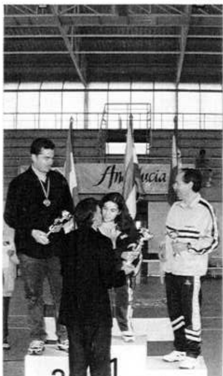
Le podium F1 D