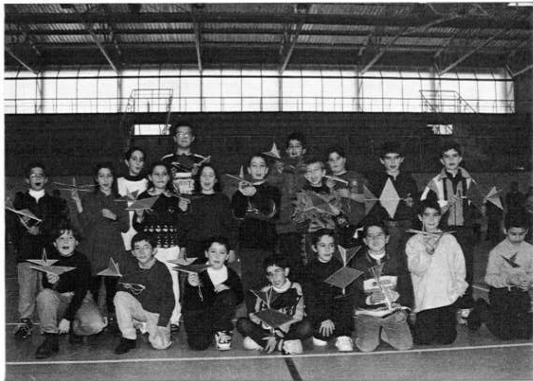
LINARES : cours d'initiation à l'aéromodélisme, 20 des 48 élèves ! Qui dit mieux ?