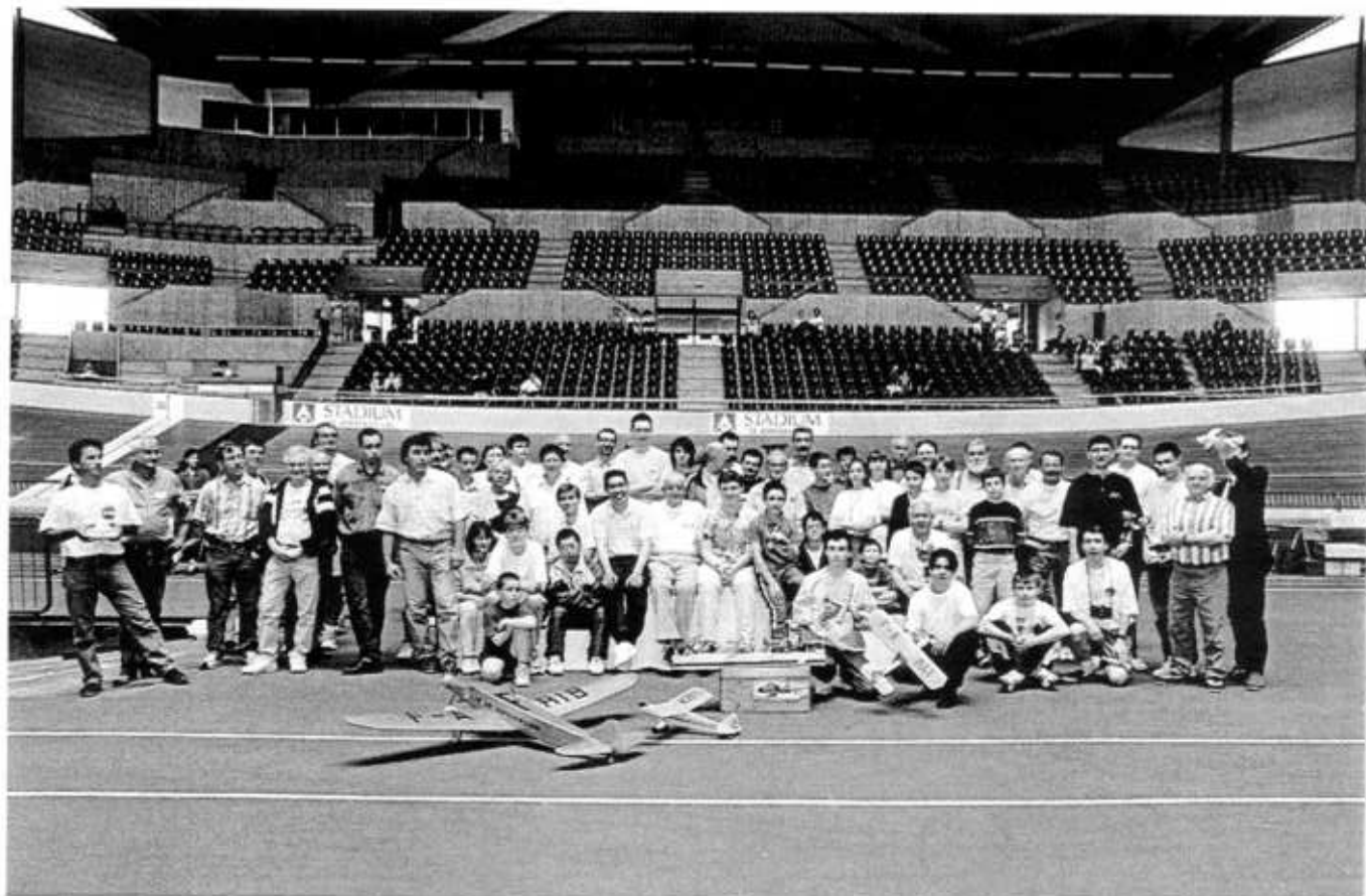
10 MAI 1998 - Stadium de BORDEAUX

Un site exceptionnel. Une participation à la hauteur! ( Plus de 30 m.) La vitalité du vol d'intérieur dans le Sud-Ouest est encore démontrée.